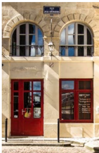
(1) Source Meilleurs Agents.

L'assemblée générale annuelle est fixée au : 13 juin 2018 à 10h30. Elle comportera une partie extraordinaire en vue de la mise en place de la convocation et du vote électronique qui permettra aux associés de voter de manière dématérialisée.